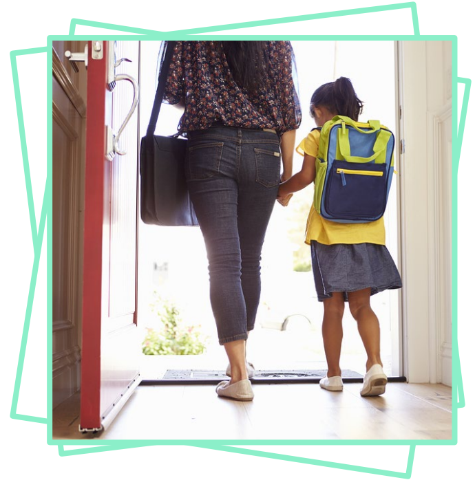
Elles sortent de la maison